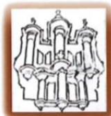
Orgue de l'Abbaye 89230 Pontigny

Monsieur le Maire informe les membres du conseil de revenir sur les deux points ajournés lors du précédent conseil du 27 février 2023 relatifs aux deux courriers reçus de l'association de l'Orgue, concernant des dons. Monsieur le Maire présente à nouveau les courriers.