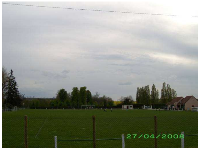
Stade de la Noue Marrou LIGNY LE CHATEL