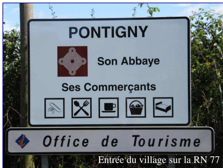
Entrée du village sur la RN 77