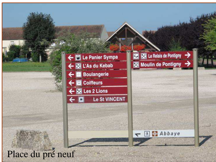
Place du pré neuf

De nouveaux panneaux ont été installés par la municipalité cet été aux entrées du village sur la RN 77 et sur le Pré neuf. Les Commerces seront ainsi mieux signalés aux visiteurs qui traversent Pontigny.