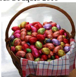
La récolte des œufs

A l'occasion des fêtes de Pâques, la municipalité a organisé la 1ère édition de la chasse aux œufs, dans le domaine de l'Abbaye. 35 enfants et leurs parents, se sont mis en quête de ces précieuses friandises en chocolat durant toute l'après midi. Après le goûter, les œufs ont été partagés entre tous les enfants et chacun est reparti avec un panier bien garni. Rendez-vous à Pâques 2010