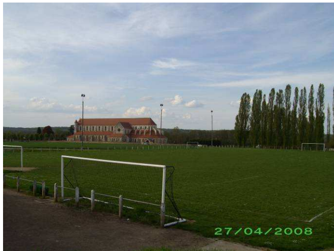
Terrain du Mille Club PONTIGNY

La saison 2008-2009 à peine terminée qu'il faut déjà préparer la suivante . Une année positive avec le maintien de notre équipe A en 1ère Division et surtout la montée de l'équipe B en 2ème Division.