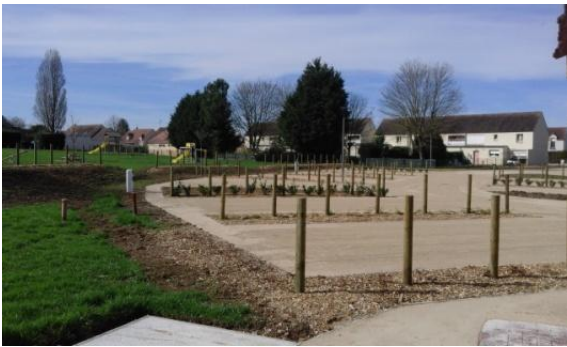
L'Aire de Stationnement

Ci-dessus, le 13 avril jour d'ouverture : Nos Iers Camping Caristes venant d'Allemagne