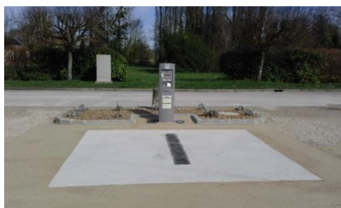
L'Aire de vidange